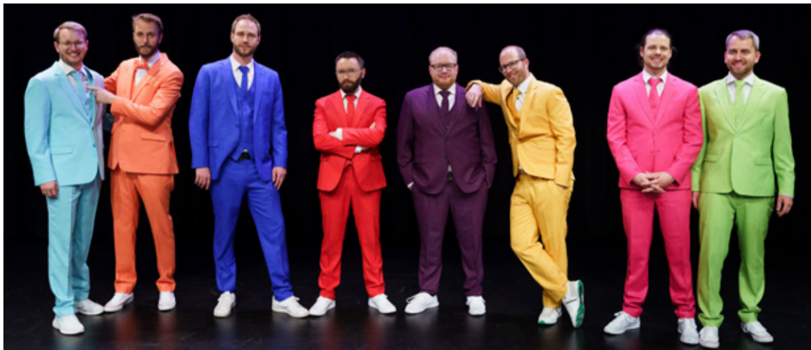
Das Brass-Ensemble UnglauBlech spielt im Kraftreaktor.

«KLANGSTROM – STROMKLANG» – 19.8. bis 4.9.2022